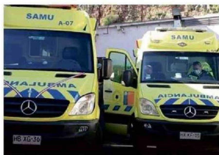
EL AUMENTO DE AMBULANCIAS NO RESUELVE EL PROBLEMA.

ayer (viernes) se había pedido un aumento de dotación de ambulancias (para el fin de semana) por si se necesitaba hacer el traslado de los niños al no haber confirmado a un médico. Hoy día el hospital tiene un médico que solamente está sacando lo más urgente porque definitivamente un médico no puede hacer mucho para atender todo lo que requiere Pediatría.