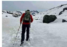
Solo se accede con guías certificados.