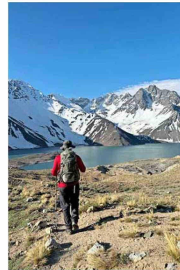
Menos del 1% del lugar tiene senderos.

N os subimos a la roca más grande, de unos cuatro metros en su punto más alto y donde cabrían fácilmente unas 30 personas. La idea es recrear la imagen que, en 1873, el intendente de Santiago Benjamín Vicuña Mackenna tomó junto a sus acompañantes aquí mismo, de espaldas a la laguna Negra, en una expedición que también incluyó la laguna del Encañado, en San José de Maipo.