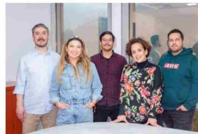
El área de I+D de JIA cuenta con un equipo multidisciplinario.