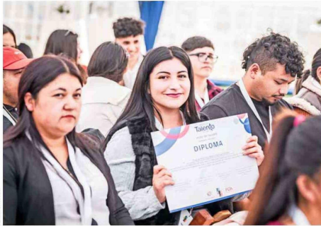
Beneficiaria curso de capacitación programa "Crecer+".