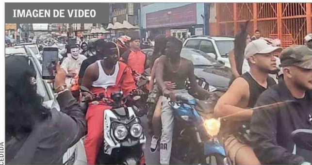
El ruidoso transitar de las motos en Antofagasta se expandió por distintos sectores de la ciudad ante la molestia de residentes locales.