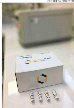
Honning Plus es un PCR similar a los para detectar el covid-19.