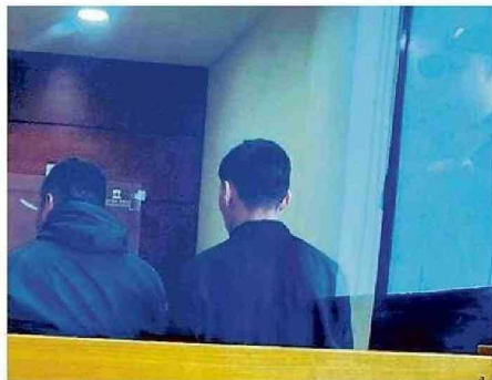
EL TRIBUNAL ORDENÓ LA INTERNACIÓN DEL JOVEN (A LA DERECHA)

de sutura. Su hijo, al ver el ataque, reaccionó.