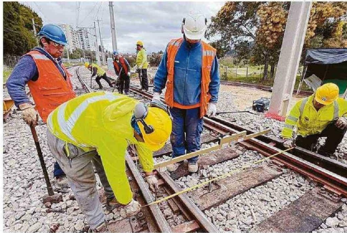
TRABAJOS, QUE TIENEN POR OBJETIVO REPARAR LAS VÍAS, SE ESTÁN REALIZANDO EN ZONA DE VALENCIA.

“Todavía no sabemos cuáles son las causas del accidente, porque efectivamente el día en que ocurrió el descarrilamiento se llamó, tal como los protocolos de emergencia estipulan, a la unidad de investigación de accidentes ferroviarias y ellos ha-