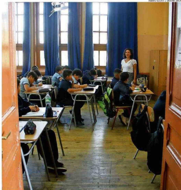
LOS ESCOLARES CHILENOS FUERON EVALUADOS POR PRIMERA VEZ EN SUS CAPACIDADES CREATIVAS.