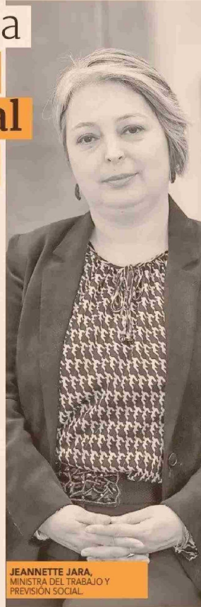
JEANNETTE JARA, MINISTRA DEL TRABAJO Y PREVISIÓN SOCIAL