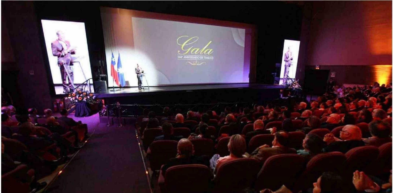
LA GALA ANIVERSARIO DE LOS 144 AÑOS DE TEMUCO SE DESARROLLÓ ANOCHЕ EN EL TEATRO MUNICIPAL CAMILO SALVO, CON LA PRESENCIA DE MÁS DE MIL 200 INVITADOS QUE REPLETARON LAS INSTALACIONES DEL RECINTO.