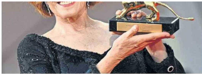
LA ACTRIZ FUE PREMIADA LA NOCHE DE AYER.

"A lo largo de mi carrera he tenido la suerte de recibir historias en las que quería participar, pe-