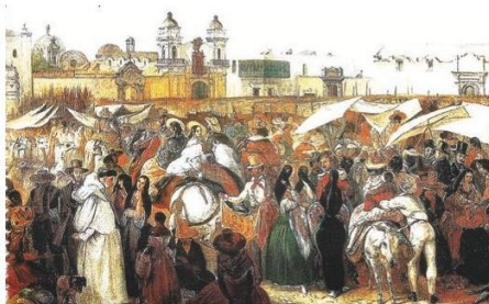
Plaza de la Independencia de Lima. Óleo de Mauricio Rugendas.