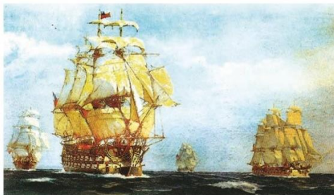
Primera Escuadra chilena. Óleo de Arturo Casanova. Colección Museo Histórico Nacional.