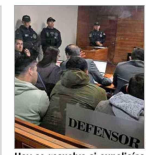
Hoy se resuelve si expolicías quedan en prisión preventiva.

Simplaner Plataforma chilena permite simular los efectos de un terremoto en la red de salud y prevenir cómo reaccionar ante la emergencia. I 6