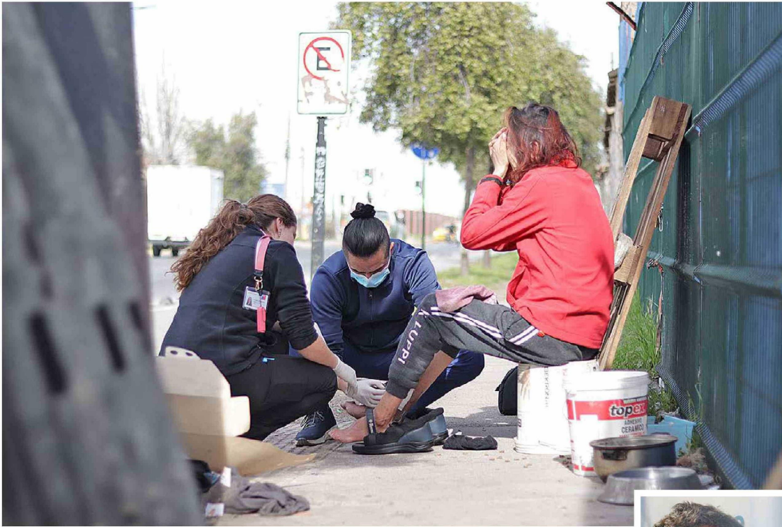
Las personas en situación de calle reciben atención médica durante el periodo de invierno.

La Seremi de Desarrollo Social y Familia en conjunto con el Servicio de Salud O'Higgins, prestarán los servicios orientados a proteger la vida y salud a las personas, producto de las condiciones climáticas durante el invierno.