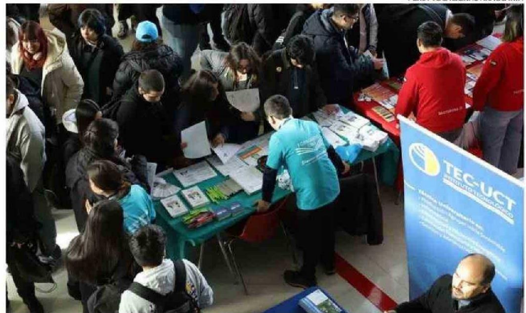
LA FERIA CONTÓ CON STANDS CON INFORMACIÓN DE UNIVERSIDADES, INSTITUTOS PROFESIONALES (IP) Y CENTROS DE FORMACIÓN TÉCNICA (CFT), SUS CARRERAS, LAS ESPECIALIDADES Y REQUISITOS DE INGRESO.

Asimismo, se realizaron charlas temáticas, entre ellas “Qué necesitas para transformar el