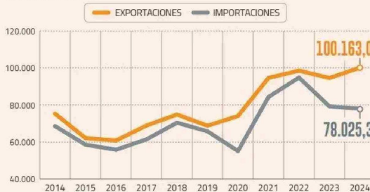
EVOLUCIÓN DEL COMERCIO EXTERIOR EN LA ÚLTIMA DÉCADA