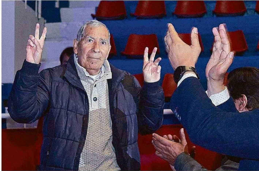
EL LEGADO DE VALENZUELA ES INMORTAL. SE LE HONRÓ EN VIDA Y SE AUSTAN VARIOS HOMENAJES DENTRO DE LAS PRÓXIMAS SEMANAS.

confirmó que el "pequeño gigante" dejó este mundo, por lo que será velado hasta hoy en el cementerio Parque del Mar de Concón, mientras que su funeral está programado para las 10.30 horas de mañana en el mismo lugar.