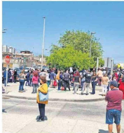
LA EMERGENCIA OBLIGÓ A EVACUAR A 2.600 PERSONAS.