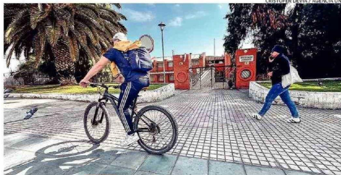
EL EDIFICIO QUE UTILIZÓ LA TELETÓN FUE COMPRADO DURANTE ESTE AÑO.