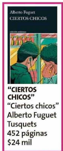
"CIERTOS CHICOS" "Ciertos chicos" Alberto Fuguet Tusquets 452 páginas $24 mil

quizás tiene otro tipo de poder. -Ahora esta novela pasa durante el régimen, época en que igual había fiestas, la gente se seguía enamorando. -Sí, pero yo lo veo de otra manera: obviamente que también había fiestas, y ahora, en Ucrania, igual, pero la cultura que celebran en este libro también es un acto de oposición, la vida contra la muerte, la cultura (de) el apagón se combate con luz. -No hay Eros sin Tánatos. -Exacto, va por ahí: en un mundo de Tánatos tienes que apostar por el Eros. Estos chicos no podían esperar a que llegara la democracia o tiempos mejores para vivir sus vidas. "ME DABA MIEDO" -¿Por qué escribir sobre la universidad después de tantos años de tu egreso? -Porque me daba miedo. -¿Porque te iban a molestar como a Clemente? -Sí, y porque lo mío fue una etapa muy traumática. -Porque te molestaban. -No sólo porque me molestaban, porque me parecía que era el infierno. O sea, el bullying es súper mo-