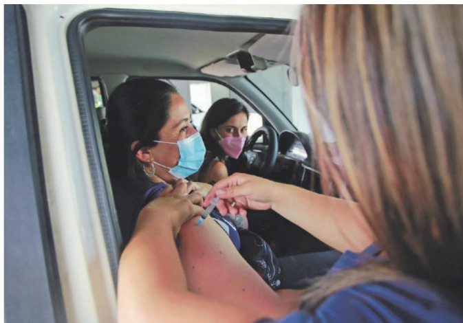
Ayer partió la vacunación de gente sana de 59 años. Hoy siguen los de 58.

tencia que en muchos vacunatorios ya habían notado, y que puede aumentar con la cuarentena, pese a que esa medida no es impedimento para ser inyectado.