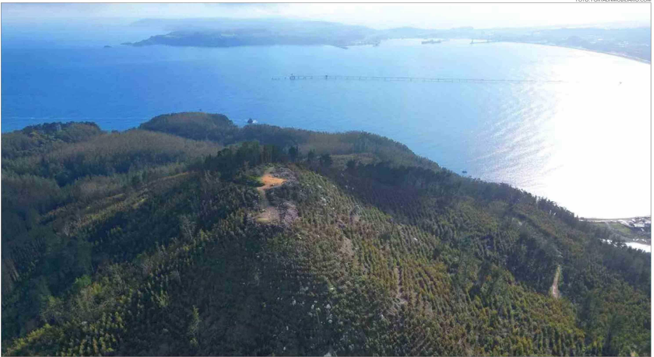
PENÍNSULA DE LA CIUDAD