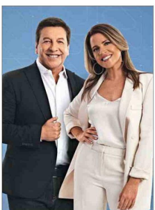
"Contigo en la mañana" ganó la batalla matinal en 2024.

El bloque matinal es, sin duda, uno de los más importantes de la TV abierta, ya que no solo activa el tren programático de los canales sino que también permite probar rostros y, asimismo, mantener en rodaje a sus figuras más importantes. Un segmento donde este año la pelea fue punto a punto y en el que el ganador fue "Contigo en la mañana", de Chilevisión, con 5,5 puntos. Le siguieron "Tu día" (5,4), "Mucho gusto" (5,3) y "Buenos días a todos" (2,8), de TVN, que no logra despegar, pero que termina el año con noticias de cambio frente a la inminente llegada de Monserrat Álvarez ante la partida de María Luisa Godoy.