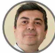
Christian Cartes Flores Contigo Chile Mejor (Ind-PPD) N° H-50

No fue posible contactarlo en esta oportunidad, pero en entrevistas con prensa de la comuna puso en valor su exadministración señalando que "una de mis