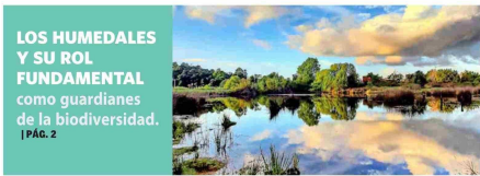
LOS HUMEDALES Y SU ROL FUNDAMENTAL como guardianes de la biodiversidad. | PÁG. 2