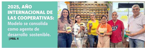
2025, AÑO INTERNACIONAL DE LAS COOPERATIVAS: Modelo se consolida como agente de desarrollo sostenible. | PÁG. 4