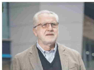
Máximo Pacheco, presidente de Codelco.

A fines de 2023 o principios de 2024 ingresaron los equipos tributarios, con el objetivo de confirmar que no hubiese perjuicios fiscales que dificultaran el respaldo del Estado al proyecto. "La idea no era optimizar en impuestos sino producir más cobre", cuenta un participante.