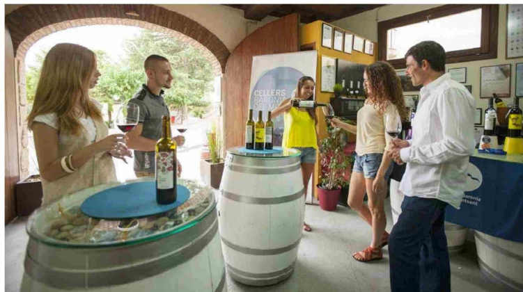
Una cata de vinos en las bodegas Cellers Baronia del Montsant en Cornudella de Montsant, Tarragona. Se trata de una bodega que elabora vinos de gran calidad, distintos y de producciones muy limitadas.

Saltamos a la otra Castilla, a La Mancha, y nos deteneos en Chinchilla de Montearagón, (antigua capital de la zona antes de desplazarse a Albacete), donde se encuentra la bodega de la Finca Los Aljibes, zona con denominación Vino de la Tierra de Castilla. El edificio de la bodega, típico casón manchego, está rodeado de 178 hectáreas de viñedo, y cultivadas a casi mil metros de altitud. Los Aljibes es una bodega -nos dicen- enfocada y diseñada para crear vinos de alta