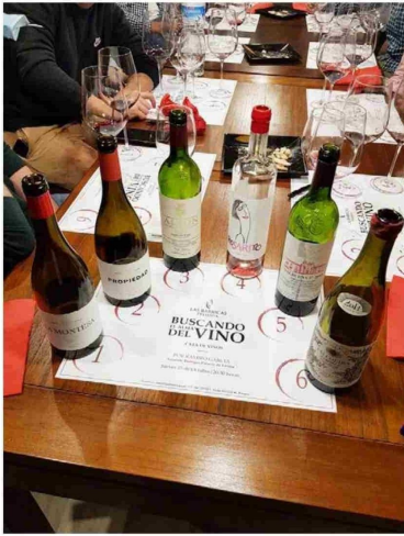
Vinos de la Bodega del Palacio de Lerma, Burgos. Castilla y León.

Sus vinos son cuidados en barricas de roble francés y americano formando un equilibrado orden de pasillos que se convierte en el lugar idóneo para el reposo de vinos de calidad. Protos, Peñafiel, Ribera de Duero, también en Valladolid. En 1927 un grupo de hombres visionarios supieron escuchar la tierra, entender sus necesidades e imaginar un proyecto de éxito que ha llegado intacto hasta nuestros días. Así nació Protos, una de las marcas más acreditadas que tienen viñedos y bodegas en Ribera del Duero y en Rueda. Sin duda la más espectacular es la nueva bodega construida en 2008 en Peñafiel, Ribera del Duero, al pie del célebre castillo. Estas instalaciones, diseñadas por Richard Rogers, premio Pritzker de arquitectura 2007, cuentan con los últimos avances tecnológicos para la elaboración de vinos de alta gama. Contando con la tradición familiar de más de cien años, las bodegas del Palacio de Lerma (Burgos) abren sus puertas para que se pueda observar su procedimiento y degustar sus vinos. Aunque existen registros sobre el cultivo de la vid en esta vieja tierra castellana desde el siglo VII, no fue hasta 2007 cuando los vinos de Arlanza consiguieron su propia denominación de origen, compuesta por 67 municipios. Esta D.O. se caracteriza por sus vinos de gran potencia, que reflejan la dureza del clima al que se enfrenta la uva, realizados, en su mayoría, con la variedad Tempranillo o Tinta del País, como se la conoce en la zona.