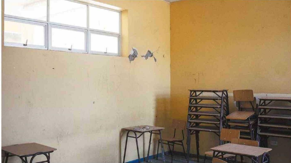
EL DAÑO MATERIAL EN ALGUNOS ESTABLECIMIENTOS ESCOLARES DE LA REGIÓN DE ATACAMA LLEGA A TENER CARACTERÍSTICAS ESTRUCTURALES.