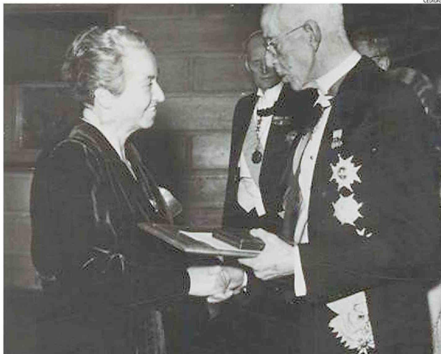
GABRIELA MISTRAL, RECIBE EL PREMIO NOBEL DE LITERATURA, POR EL REY GUSTAVO V DE SUECIA.

de diciembre de 1945 Gabriela Mistral recibió el premio Nobel de Literatura.