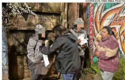
LA ENTREGA DE ALIMENTOS EN LAS CALLES ES UNA DE SUS LABORES.

Existen personas que escriben pidiendo ayuda para un caso específico, y todo se recibe. La gente nos contacta a través de las redes, nos cuenta un poco la historia, verificamos que sea real y luego organizamos la campaña. La comunidad sabe que, aunque no se trate necesariamente de niños o de personas en situación de calle, si es un caso importante, lo recibire-