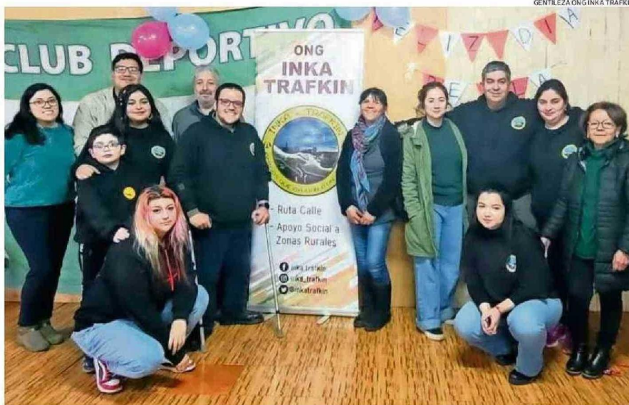
LA ONG INKA TRAFKIN FUNCIONA CON VOLUNTARIOS Y DE MANERA INDEPENDIENTE. RECIBEN A NUEVOS INTEGRANTES "QUE SEAN CONSTANTES".

"Cada lugar al que vamos es como una novedad, porque llegamos con el Viejo Pascuero, con regalos, juegos, dinámicas y diferentes actividades. Nos piden que volvamos, y se va todo el año. Son localidades que, aunque quizás no estén tan aisladas en términos de modernidad, tienen muchas necesidades. Justamente, la ayuda no llega a esos lugares porque están lejos, o porque a veces el montaje de las actividades es complicado. Sin embargo, nuestro objetivo