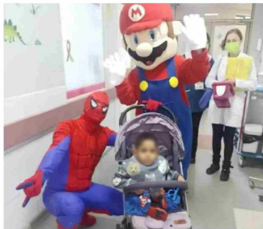
AL LLEGAR A UNO DE LOS CONTROLES en el Servicio de Oncología del Hospital Regional de Concepción.

Este tumor se presenta en los músculos que van adheridos a los huesos, y se puede presentar en muchos lugares del cuerpo, donde los lugares más comunes son la cabeza y el cuello, el sistema urinario, el reproductor, y los brazos y piernas.