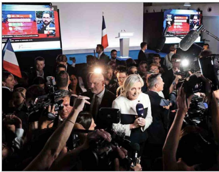
LE PEN calificó los resultados como una "victoria en diferido" para RN.

tiva en la Asamblea. Mélenchon aseguró que Francia evitó su "peor escenario posible", pero que también quedó clara "la derrota del Presidente y de su coalición".