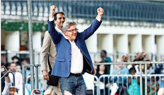
MÉLENCHON exigió a Macron que el próximo gobierno sea de la izquierda e impulse solo su programa.

Lo que no fue una sorpresa es que el "frente republicano" tuvo una corta vida. Una vez conocidos los resultados, el líder de La Francia Insuñisa (LFI, izquierda radical), Jean-Luc Mélenchon, exigió al Presidente Emmanuel Macron nominar a un premier que venga del NFP, aunque la coalición solo tenga una mayoría rela-