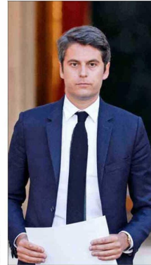
ATTAL anunció su renuncia al cargo de primer ministro.