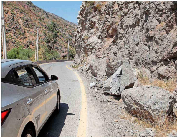
Desprendimientos de rocas de hasta 2 metros, representan un peligro.