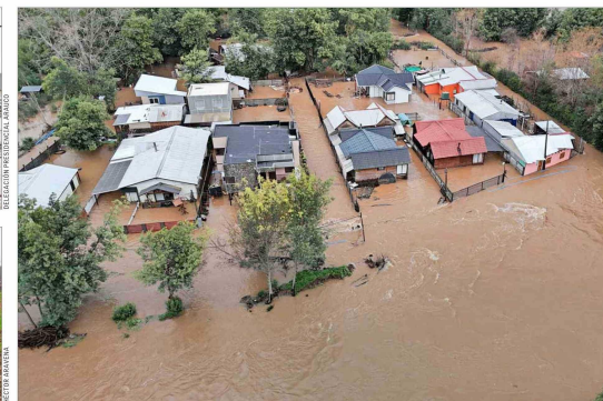
La vicepresidenta Carolina Tohá (zquierda, arriba) recorrió ayer Curanilahue, la comuna más afectada en el sur por el temporal, donde los vecinos reclamaron una pronta reposición del servicio de agua potable. En tanto, fuertes críticas surgieron luego que un nuevo episodio de inundación del paso bajo nivel de la avenida Teniente Cruz en Pudahuel res-