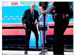
La primera dama, Jill Biden, tuvo que ayudarlo a bajar los pequeños escalones del escenario tras el evento.

Preocupación entre demócratas: La opción de sustituir a Joe Biden toma fuerza en su partido tras mal desempeño en debate