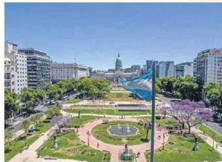
BUENOS AIRES DESTACA POR SU IDENTIDAD Y GASTRONOMÍA.

anotó un alza de 17,5% en comparación a la temporada anterior. En el tercer y cuarto lugar se posicionaron Iquique y Temuco. Los tickets a ambas ciudades experimentaron este año un aumento del 8,5% y 25%, respectivamente.