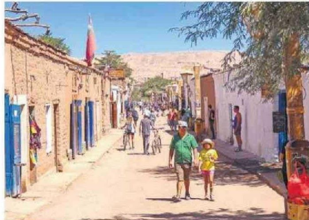
SAN PEDRO DE ATACAMA MARAVILLOSA POR SUS PAISAJES.

La aerolínea también compartió una de sus principales tendencias alcanzadas. “Entre diciembre de 2024 y febrero de 2025 proyectamos transportar 3,3 millones de pasajeros en Sudamérica. Tan solo en diciembre de 2024 transportamos 1,15 millones de pasajeros, lo que re-