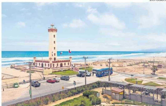
LA CAPITAL REGIONAL DE COQUIMBO OFRECE SUS EXTENSAS PLAYAS Y ATRACCIONES.

“Para satisfacer la alta demanda del verano, la compañía puso a disposición de sus pasajeros más de 142.373 vuelos, equiva-