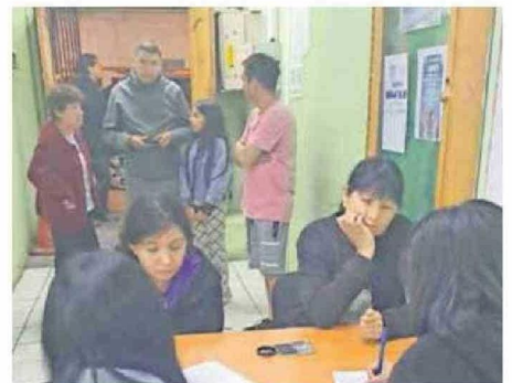
EL MUNICIPIO DE CALAMA HIZO ENTREGA DE NYLON PREVENTIVAMENTE.

La isoterma cero, ubicada entre los 4.900 y 5.200 metros sobre el nivel del mar, también plantea desafíos adicionales, ya que el derretimiento de nieve podría contribuir a aumentos