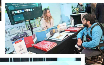
Las diversas fundaciones que participaron del encuentro explicaron los proyectos que están impulsando para la revitalización de los espacios públicos.