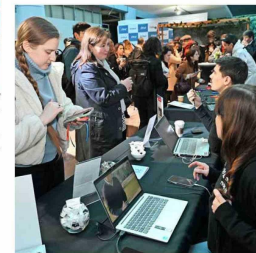
Los asistentes recorrieron los diferentes stands de las fundaciones y universidades que colaboraron en esta 13ª versión de la conferencia organizada por la CChC.