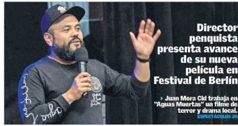
Director penquista presenta avance de su nueva película en Festival de Berlín

► DT de la UdeC palpita debut en casa en la Liga de Ascenso. DEPORTES 13