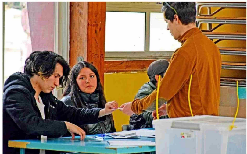
UNA DE LAS RECOMENDACIONES entregadas es evitar los horarios peak de exposición solar.

Como hará calor durante este fin de semana, Espinoza expresó que es de suma impor-