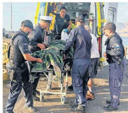
EL AFECTADO FUE TRASLADADO AL HOSPITAL DE TOCOPILLA.

Finalmente, cerca de las 19:35 horas, el tripulante accidentado fue desembarcado en el Muelle