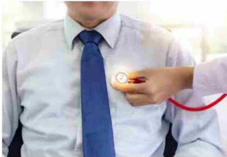
Infartos al miocardio, antiguamente asociados a personas mayores, están siendo cada vez más frecuentes en menores de 45 años.