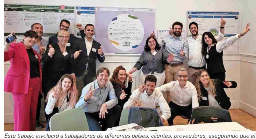
Este trabajo involucró a trabajadores de diferentes países, clientes, proveedores, asegurando que el propósito reflejara tanto la realidad como las aspiraciones de toda la organización y los actores que se relacionan con ella.