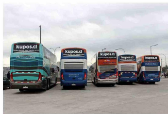
Kupos.cl, principal app de transporte terrestre.

un importante actor a la hora de democratizar el acceso a los medios de pago.