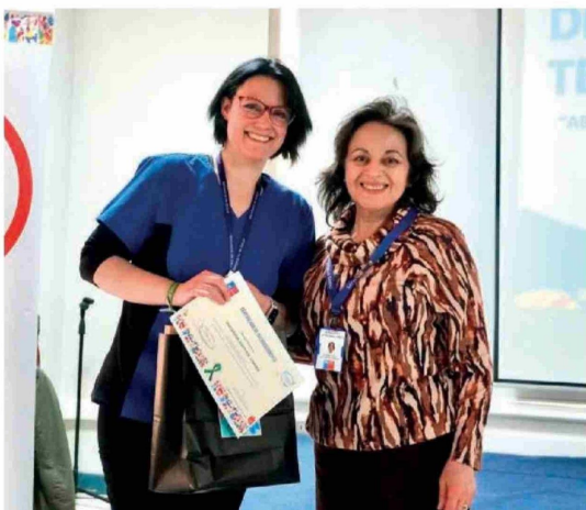
JORNADA DE TRASPLANTE y Procuramiento de Órganos y Tejidos.

Se trata, según Monreal, de una plataforma de información en que "también tratamos de educar a través de ese canal, para que tenga acceso a la información toda la población y también pueda haber transparencia. Es importante decirles qué es el proceso de donación, cuándo se extraen órganos y por qué se van a trasplantar. Eso es lo que tratamos de contar en esta página web, que no son sólo números, no son sólo cifras, sabemos que después se traducen en cambios de vida y que incluso salvan vidas".