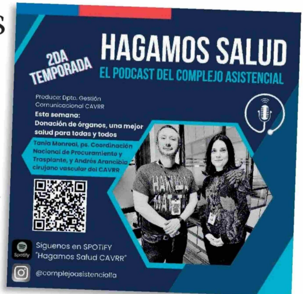
AFICHE PROMOCIONAL del Capítulo 22, de la segunda temporada del Podcast "Hagamos Salud".

Monreal mencionó que "una de las cosas que hemos visto a través de este encuentro con los equipos, y que siempre preguntan, es: ¿cómo está resultando esto? ¿Lo hacemos bien? ¿Lo hacemos mal? La experiencia común es que las familias agra-