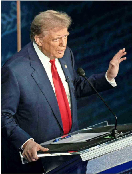
HARRIS Y TRUMP concentrarán sus campañas en los estados clave tras el debate, según los medios locales.

La demócrata hizo hincapié en el tema migratorio. "Soy la única persona en este escenario que ha perseguido judicialmente a gru-