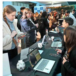
Los asistentes recorrieron los diferentes stands de las fundaciones y universidades que colaboraron en esta 13ª versión de la conferencia organizada por la CChC.