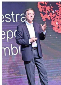
El invitado internacional Guillermo Peñalosa expuso sobre la "Creación de Ciudades 8-80 para todos. Sostenibles, equitativas y divertidas".