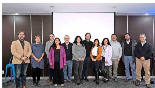
Junto al Barro, Deficci Caro, Techo-Chile y Ciudad de Bolsillo participaron en el conversatorio "Mesa Ciudad e Inequidad".