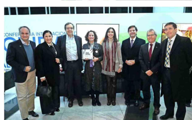
Autoridades de la CChC visitaron el stand de la Corporación Ciudad Accesible.