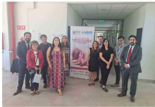
Equipo multidisciplinario del Programa Regional de Cáncer Hereditario, académicos de la Facultad de Medicina UCM, seremi de Salud de la Región del Maule y colaboradores internacionales de Argentina (LUNCUYO, HEMA y Conicet) y Francia (Centro Oncológico Georges François Leclerc).

mejorar los tratamientos y también hacer una intervención mayor en los núcleos familiares. "El proyecto, además, tiene un componente innovador en esta iniciativa que estamos apoyando con mucho entusiasmo", enfatiza. Subraya que este programa es un real aporte a la comunidad. "Es una contribución que comienza haciéndonos cargo de una realidad, a través de un tratamiento adecuado. Evidentemente, es un aporte a la comunidad, considerando que estamos implementando medidas para aliviar la situación compleja que significa saber que uno padece cáncer de mama. Este proyecto nos ayudará a seguir tomando decisiones que nos permitan avanzar en algo esencial que es una mejor salud para todos y todas", sostiene el gobernador regional de Atacama. Esta alianza, acogida por el Hospital Regional de Copiapó, tiene la colaboración de la comunidad y de organizaciones locales, fundamentales para el éxito de este programa. La