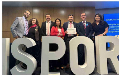
Integrantes del Grupo Chileno de Cáncer Hereditario (GCCH) en la ceremonia de premiación del ISPOR (The International Society for Pharmacoeconomics and Outcomes Research), donde el GCCH fue galardonado y reconocido por su alto impacto en la salud de Chile.