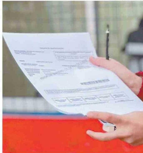
ATACAMA TUVO LOS PEORES RESULTADOS EN LA ÚLTIMA PAES.

Así, pese a la rapidez del municipio de Diego de Almagro en presentar de manera formal un nuevo proyecto de preuniversitario por el total de 60 millones de pesos disponible, la insitucionalidad regional no pudo revisar el detalle de la presentación y ponerlo a disposición del pleno del Consejo Regional en la sesión del martes 3 de septiembre. Con ello, el proyecto podría ser revisado recién el 10 de sep-