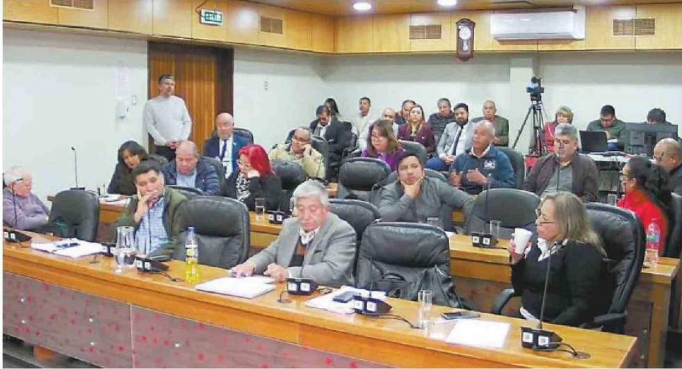
AGRIAS DISCUSIONES EN EL PLENO DEL CONSEJO REGIONAL SE DIERON EN EL MARCO DE LA DISCUSIÓN DEL PROYECTO DE PREUNIVERSITARIO.